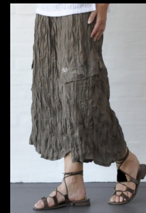
E-design forår 2010. Ikke alle modeller fås i alle butikker.