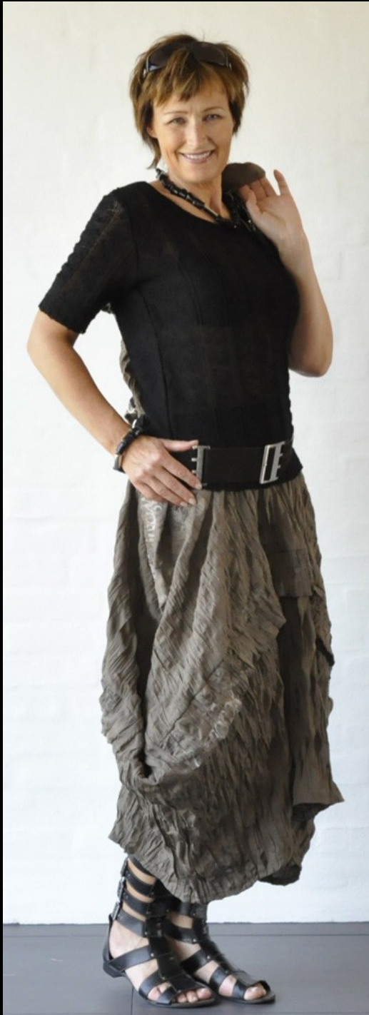
E-design forår 2010. Ikke alle modeller fås i alle butikker.